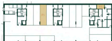
Lugar de Garagem e Arrumo Localização Segunda Cave