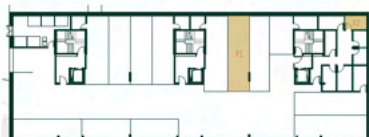
Lugar de Garagem e Arrumo Localização Segunda Cave