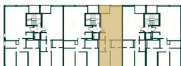
Localização da fracção J