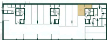
Lugar de Garagem e Arrumo Localização Segunda Cave