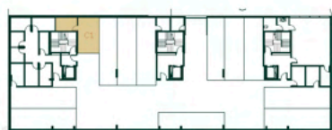
Lugar de Garagem e Arrumo Localização Primeira Cave