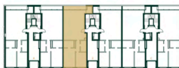
Localização da fracção C