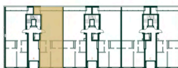
Localização da fracção B