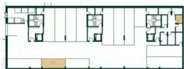
Lugar de Garagem e Arrumo Localização Segunda Cave